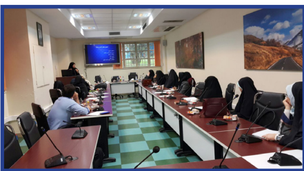
انجمن علمی- دانشجویی مطالعات زنان برگزار کرد: