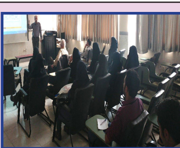
انجمن علمی- دانشجویی آمار برگزار کرد:

در این نشست نمونه مطالعه موردی در خصوص شرایط زنان مهاجر افغان در کشور آلمان مورد بررسی قرار گرفت و روش‌های تحقیق کیفی مورد استفاده در این پژوهش با ذکر مثال موردی تشریح شد.