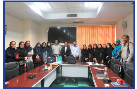
انجمن علمی- دانشجویی زبان فرانسه برگزار کرد: